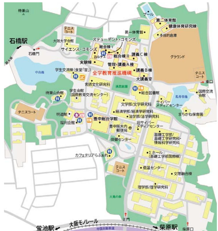
豊中キャンパス マップ